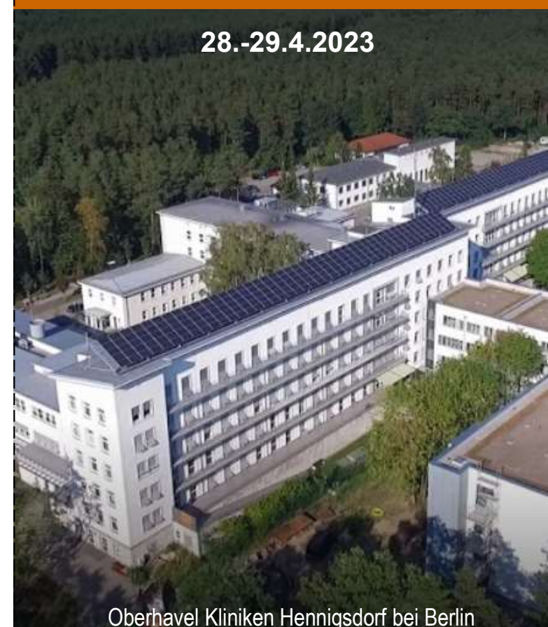
Oberhavel Kliniken Hennigsdorf bei Berlin