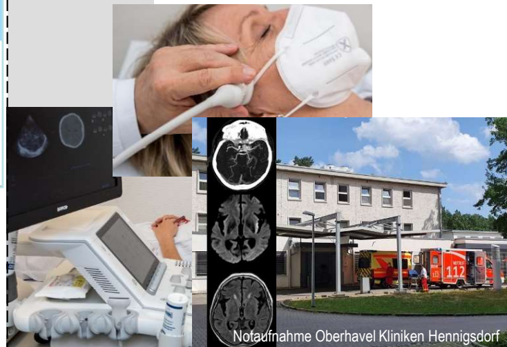
Notaufnahme Oberhavel Kliniken Hennigsdorf