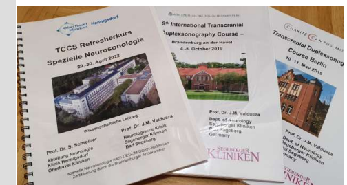
Kurs-Handout mit allen Beiträgen