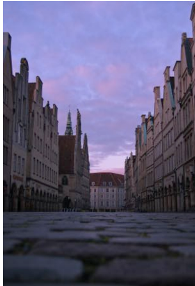
Die Giebelhäuser am Prinzipalmarkt

Die Promenade ist die grüne Verkehrsader von Münster und umschließt die Innenstadt. Sie wird gerne als Joggingstrecke und Spazierweg benutzt.